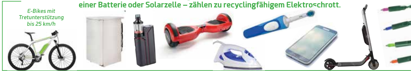
E-Bikes mit Tretunterstützung bis 25 km/h

Fast alle Geräte, die Strom benötigen – ob aus der Steckdose, dem Telefonkabel, einer Batterie oder Solarzelle – zählen zu recyclingfähigem Elektroschrott.